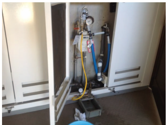
⑥1時間の放置後確認、異常なしです。