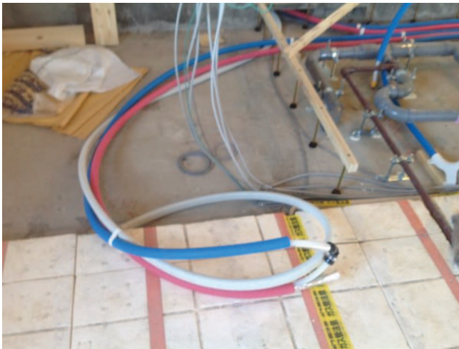
③水圧テスト用給水・給湯配管の接続