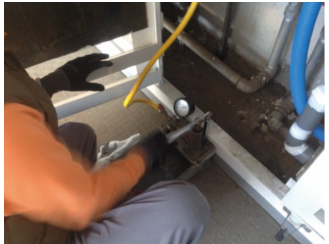
④PSにて、水圧テストの準備作業