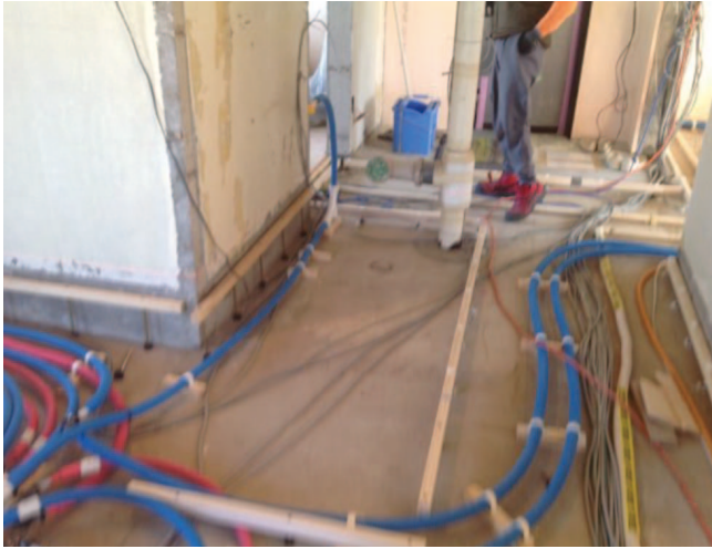
①水道配管と二重床下地取合い調整