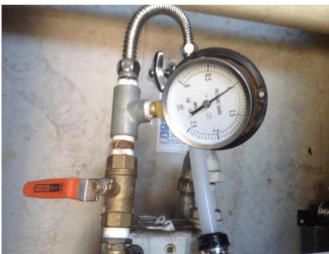
⑤水圧テスト開始、1KGの加圧